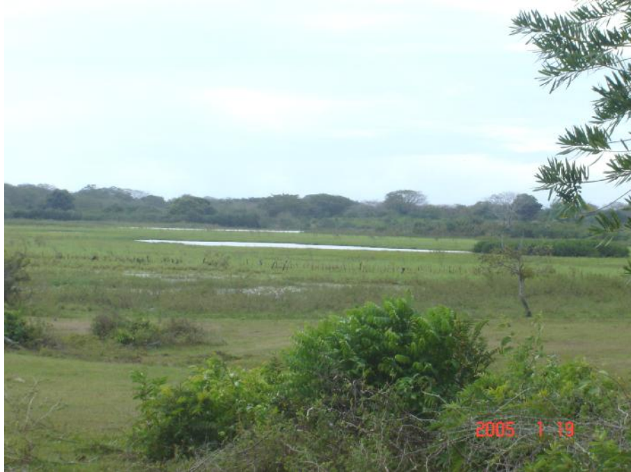
Fig. 2. Vista del Humedal, la Ciénaga Jesusgenio A (la de primera vista) y B (al fondo) (de difícil acceso)

La pesca es realizada en el humedal por 10 pescadores que provienen de la comunidad de Juan Hombrón; utilizan como arte de pesca 5 redes utilizando el sistema de cerco y arrastre con una producción de 1,000 kilos anuales (José Flores, 2005, comunicación personal).