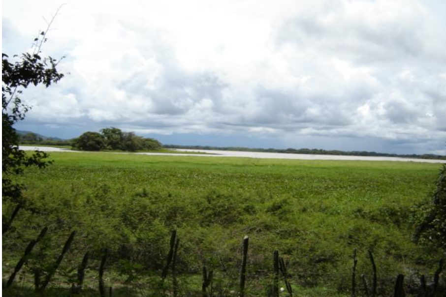
Fig. 2. Vista del humedal, Ciénaga de Las Macanas

Las características físico-químicas del agua presentan concentraciones en promedio de 5 mg/l para el oxígeno disuelto y temperatura de 30° C. (PREPAC a, 2004) (Fig. 2)