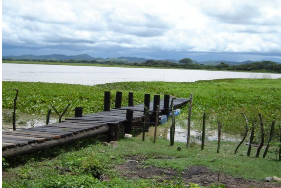
Fig. 3 Vista del desembarcadero

El principal uso del cuerpo de agua es el turismo, no teniéndose referencia del número de visitantes al año, la pesca representa una producción estimada de 3,200 kilogramos anuales. (PREPAC a, 2004)