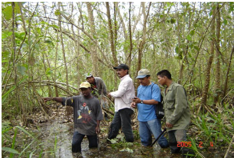
Fig. 2. Vista del humedal, La Doncella

No hay referencia de actividad pesquera en el humedal. En la actualidad no existen proyectos de acuicultura en el humedal o en su entorno.