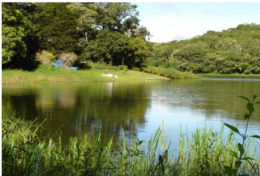
Fig. 2. Vista del humedal, Las Lagunas de Volcán A

La pesca es realizada en el humedal por 15 pescadores eventuales, que utilizan como arte de pesca 15 anzuelos y caña de pescar con una producción estimada de de 1,600 kilos anuales. (De La Torre, 2004, comunicación personal).