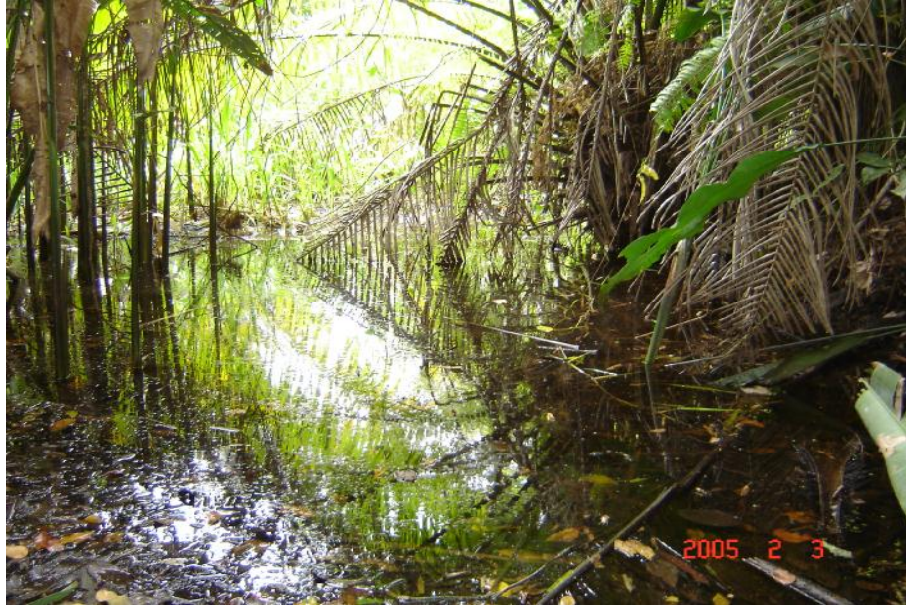
Fig. 2. Vista del humedal, Laguna del Ocho

No hay referencia de actividad pesquera. En la actualidad no existen proyectos de acuicultura en el humedal o en su entorno.