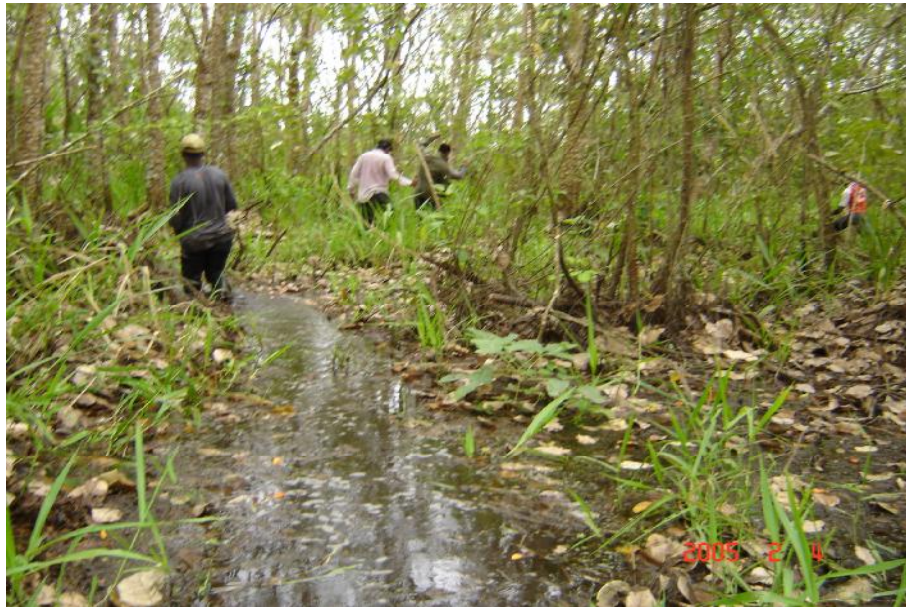
Fig. 2. Vista del humedal, Laguna de Marragantí 1

No hay referencia de actividad pesquera. En la actualidad no existen proyectos de acuicultura en el humedal o en su entorno.