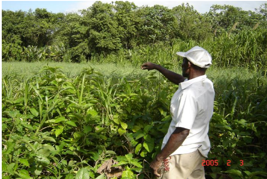
Fig. 2. Vista del humedal, Marragantí 2, en verano

No hay referencia de actividad pesquera en el humedal. En la actualidad no existen proyectos de acuicultura en el humedal o en su entorno.