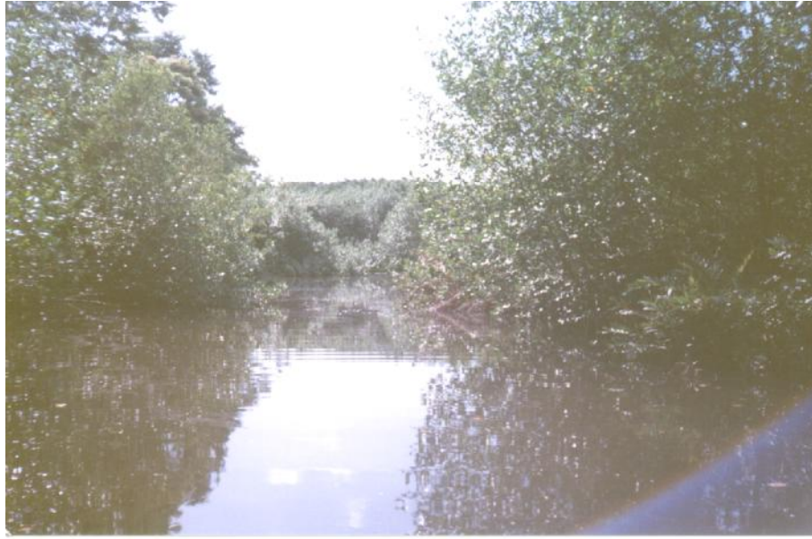
Fig. 2. Vista de la laguna costera, Lago Chong Point

La pesca es realizada en la laguna por 3 pescadores eventuales, en 3 cayucos que utilizan como arte de pesca 3 anzuelos y líneas. Se estima una producción de 300 kg anuales (Jorge García, 2005, comunicación personal).