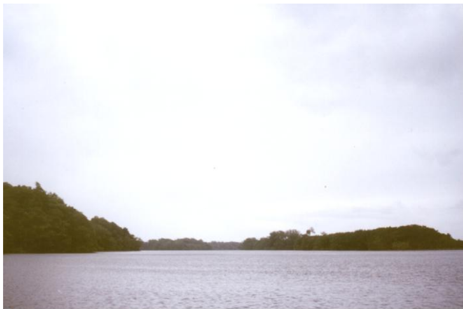
Fig. 2. Vista de la entrada a la Laguna Tagajet.

No hay referencia de actividad pesquera en la laguna costera.