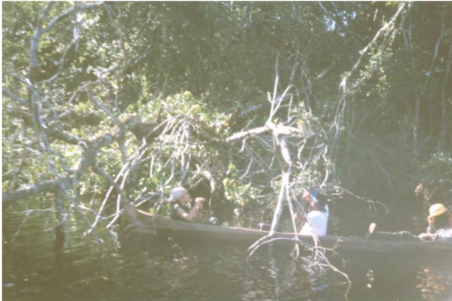
Fig. 2. Vista de la Laguna Damaní

No hay referencia de la profundidad promedio ni de la máxima. Es de agua salobre y fondo arenoso, se desconocen otras características físico-químicas del cuerpo de agua. (Jorge García, 2005, comunicación personal) (Fig. 2)