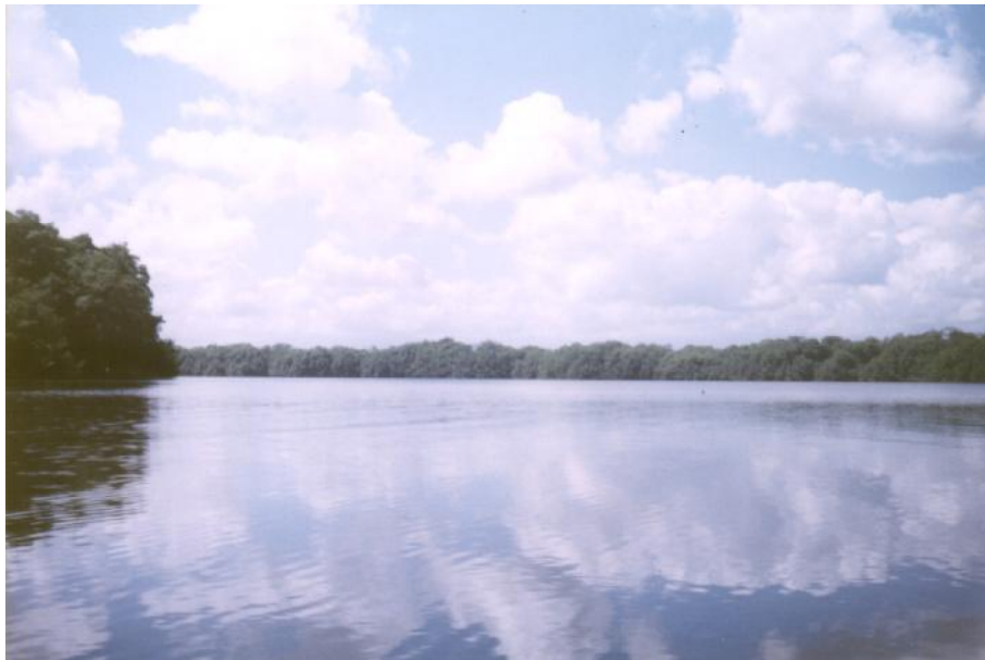
Fig. 2 Vista de la Laguna de Juglí.

No hay referencia de la profundidad promedio ni de la máxima. Es de agua salobre y fondo arenoso, se desconocen otras características físico-químicas del cuerpo de agua. (Jorge García, 2005, comunicación personal) (Fig. 2)