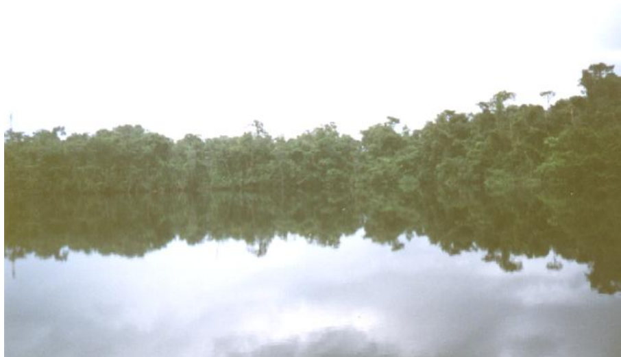
Fig. 2. Vista de la laguna costera, Río Diablo

La pesca es realizada en la laguna por 25 pescadores de la comunidad de Río Diablo, que cuentan con 10 cayucos. De los cuales, 10 utilizan como arte de pesca 10 anzuelos y líneas y 15 pescadores utilizan 10 trasmallos. Se estima una producción de 1,400kg y 10,000 kg anuales respectivamente. (Jorge García, 2005, comunicación personal).