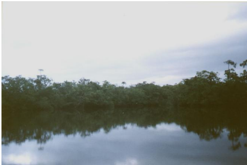
Fig. 2. Vista de Laguneta, Laguna Agua Negra 1

No hay referencia de la profundidad promedio ni de la máxima, son profundas de fondo negro y aguas oscuras. Se desconocen otras características físico-químicas del cuerpo de agua. (Jorge García, 2005, comunicación personal) (Fig. 2)