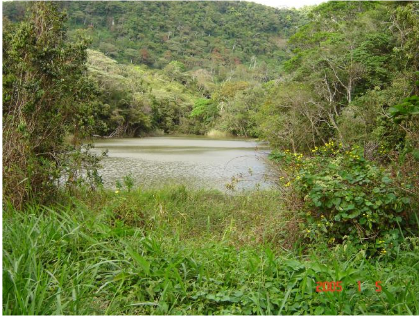
Fig. 2. Vista de la Laguneta La Charca Pequeña

La Laguneta es de uso de la comunidad para actividades recreativas y no hay pesca establecida.