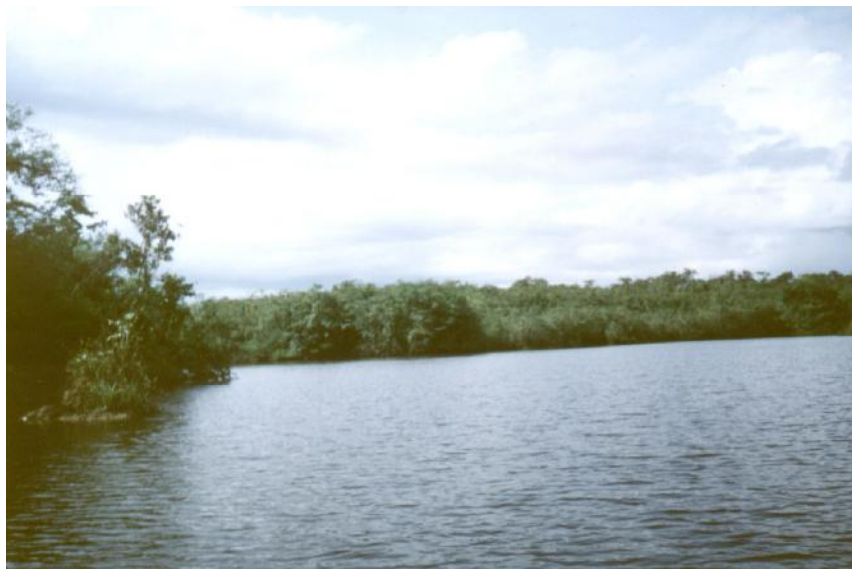
Fig. 2. Vista de Laguna Durí

No hay referencia de actividades de pesca en la laguneta.