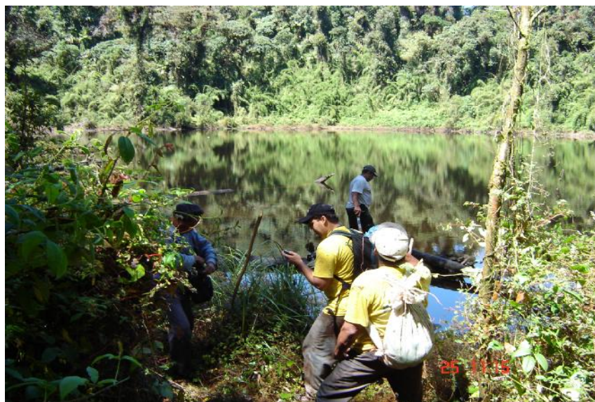
Fig. 2. Vista de la Laguneta, Laguna Escondida Parque Internacional La Amistad, Bocas del Toro.

En la actualidad no existen proyectos de acuicultura en la laguneta o en su entorno.