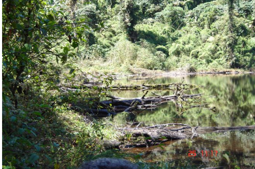
Fig. 3. Vegetación boscosa alrededor de la laguneta.

La Laguneta se encuentra rodeada de espesa vegetación boscosa de altura, presenta troncos en su superficie que han caído por procesos naturales. El cuerpo de agua se encuentra fuertemente sedimentado con una capa de 1.5 metros de cieno. (PREPAC A, 2005) (Fig 3).