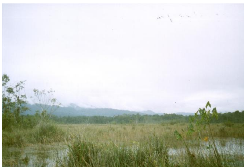
Fig. 2. Vista de Laguneta Oiba 1

No hay referencia de actividades de pesca en la laguneta.