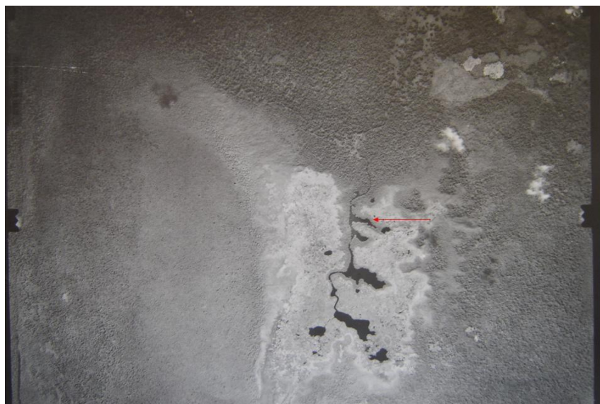
Fig. 1b Ortofoto de la Laguneta Oiba 1