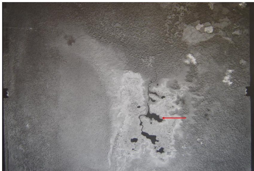
Fig. 1b. Ortofoto de la Laguneta Oiba 2