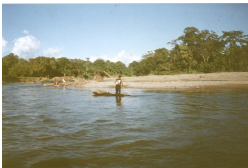
Fig. 2. Vista de Laguneta Oiba 2

No hay referencia de actividades de pesca en la laguneta.