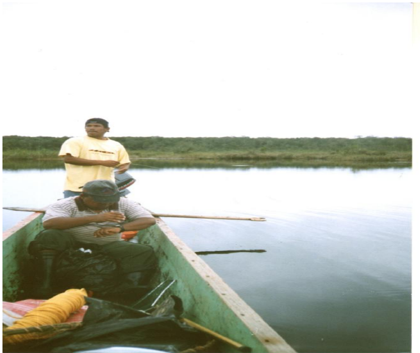
Fig. 2. Vista de la Laguneta Oiba 3

No hay referencia de actividades de pesca en la laguneta.