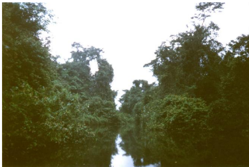
Fig. 2. Vista de Laguna Río Negro

No hay referencia de actividades de pesca en la laguneta.