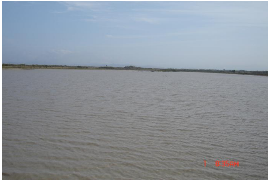
Fig. 2. Vista del reservorio, Agua Blanca

La pesca es realizada en el reservorio por 15 pescadores de la comunidad de Aguas Blancas, que utilizan como arte de pesca 5 redes utilizando el sistema de cerco y arrastre, con una producción de 400 kilos anuales para época de verano. (PREPAC a, 2005)