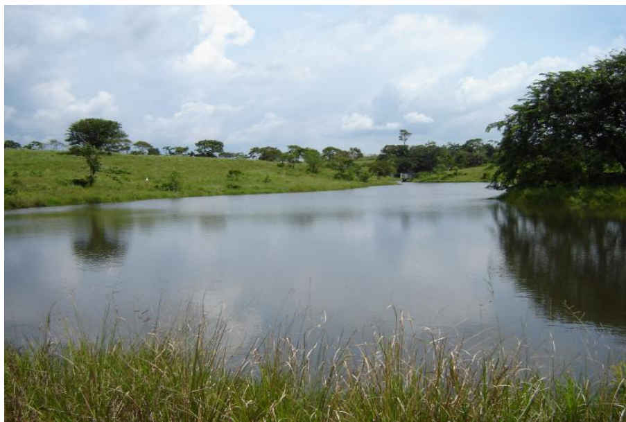
Fig. 2. Vista del reservorio, Agustín Díaz

Debido a que es un cuerpo de agua privado, no hay actividad pesquera ni acuícola.