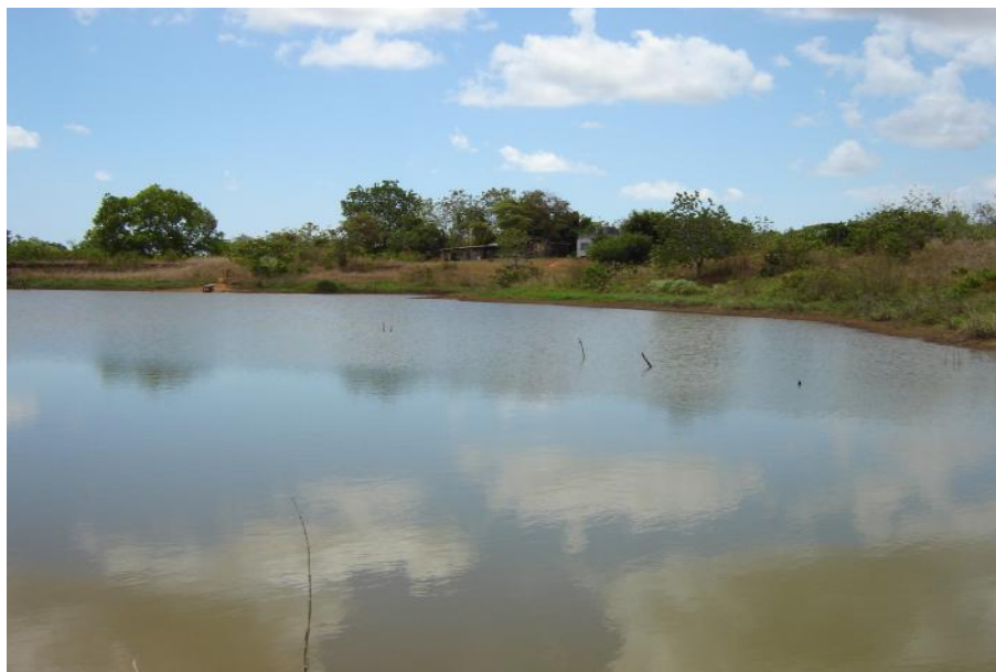
Fig. 2. Vista del reservorio Campamento

No se realiza pesca en este cuerpo de agua. En la actualidad no existen proyectos de acuicultura en el reservorio o en su entorno.