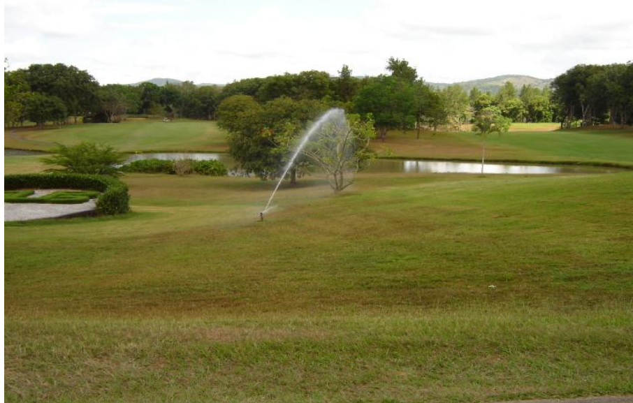
Fig. 3. Vista de riego del área verde Club de Golf 1

La legislación sobre el reservorio implica leyes de carácter nacionales como la Ley 1 de 1994; Ley 30 de 1994; Ley 28 de 1995; Ley 24 de 1996; Ley 58 de 1995; Ley 41 de 1998, el Decreto Ley No.7 de 1959; No35 de 1966; y los Decretos Ejecutivos No.11 de 1997; No.58 de 1998; No.59 de 2000. (PREPAC b, 2004)