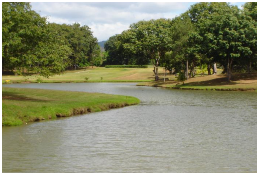
Fig. 2. Vista del reservorio Club de Golf 1

No se realiza pesca en este cuerpo de agua. Es prohibido toda actividad de pesca, solicitado por los miembros del club.