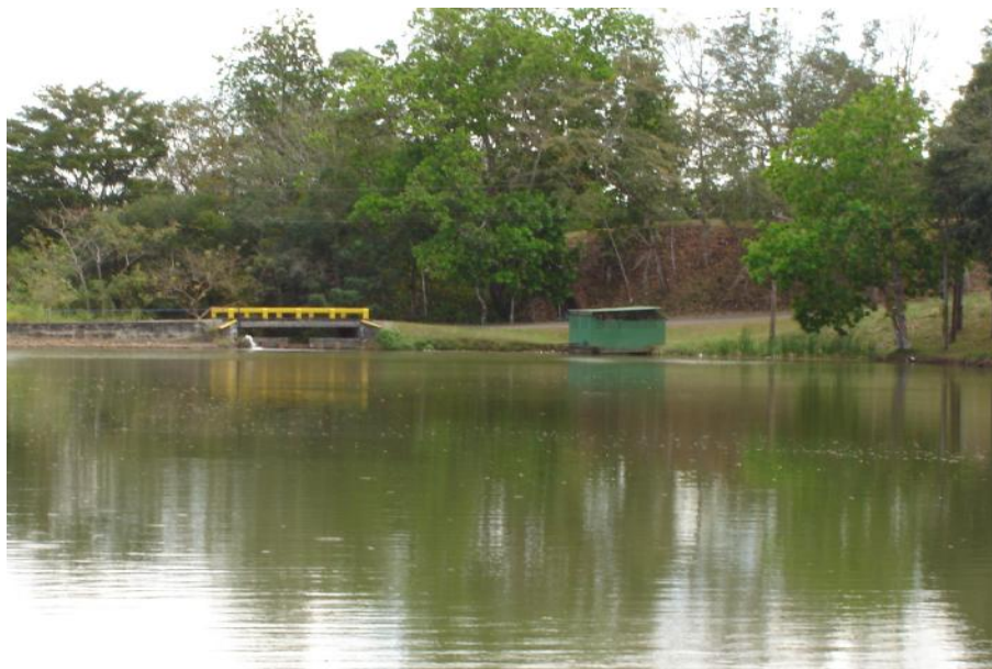
Fig. 2. Vista del reservorio Club de Golf 2

No se realiza pesca en este cuerpo de agua. Es prohibido toda actividad de pesca, solicitado por los miembros del club.