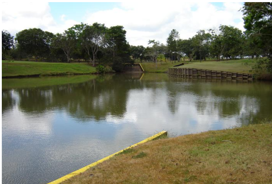
Fig. 2. Vista del reservorio Club de Golf 3

No se realiza pesca en este cuerpo de agua. Es prohibido toda actividad de pesca, solicitado por los miembros del club.