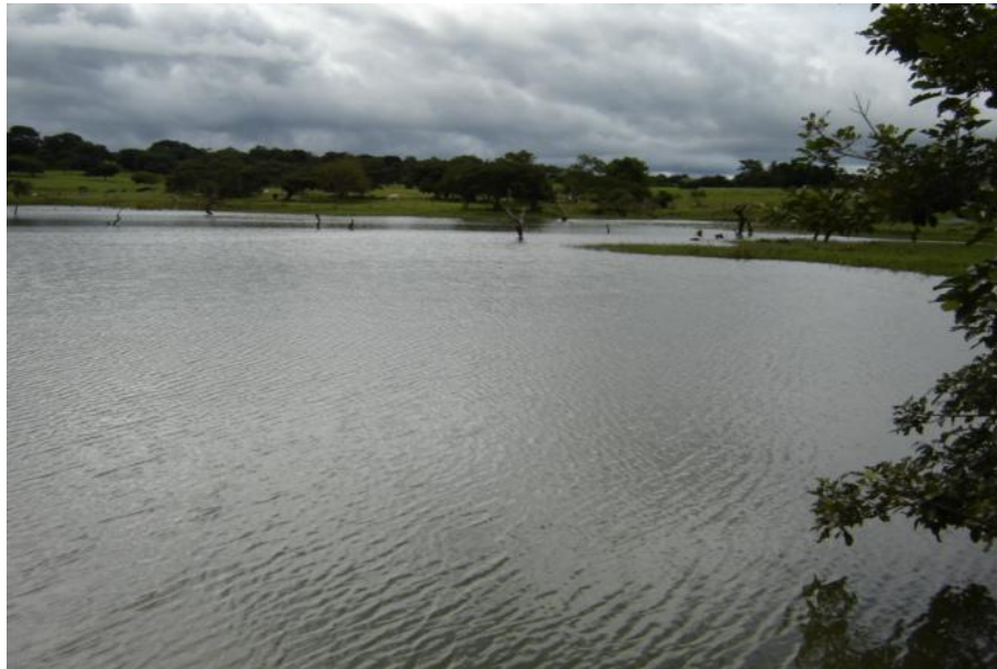
Fig. 2. Vista del reservorio, El Vencedor

Las características físico-químicas del agua presentan concentraciones en promedio de 8.5 mg/l para el oxígeno disuelto y temperatura de 29°C. (PREPAC. a, 2004) (Figura 2)