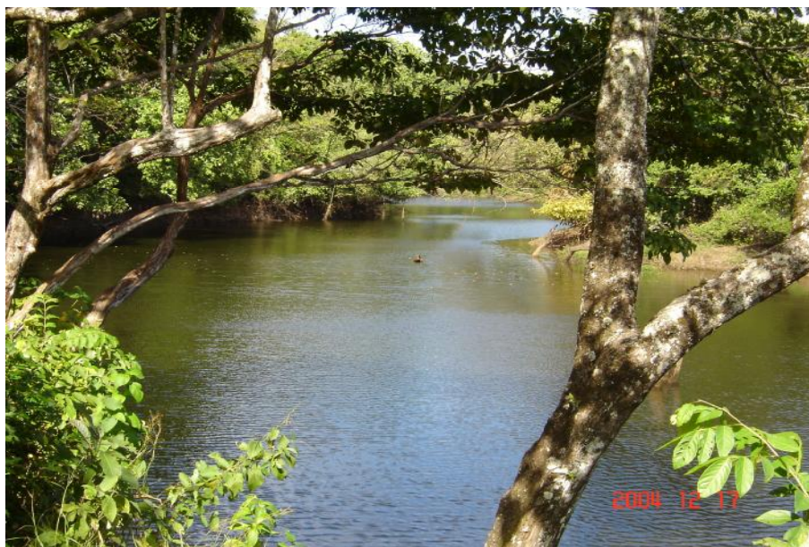
Fig. 2. Vista del reservorio, Esperanza

La pesca es realizada en el reservorio por 3 ó 4 pescadores eventuales, que utilizan como arte de pesca 5 líneas con anzuelos con una producción de 50 kilos anuales.