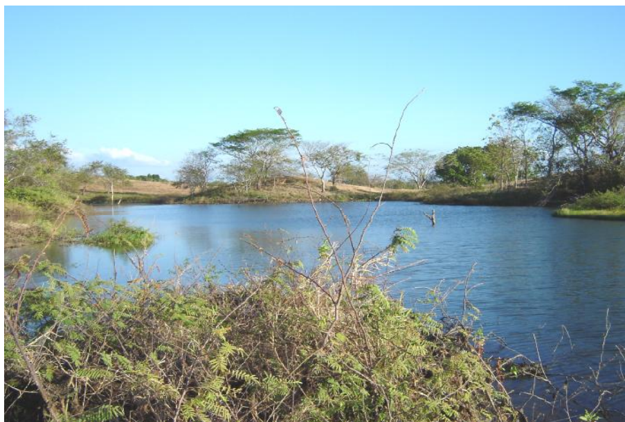
Fig. 2. Vista del reservorio Higuera 1

No se realiza pesca en este cuerpo de agua.