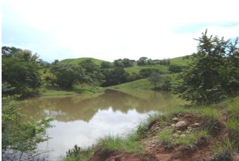
Fig. 2. Vista del reservorio, Joaquín Medrano

Las características físico-químicas del agua presentan concentraciones en promedio de 5 mg/l para el oxígeno disuelto y temperatura de 31°C. (PREPAC a, 2004) (Fig. 2)