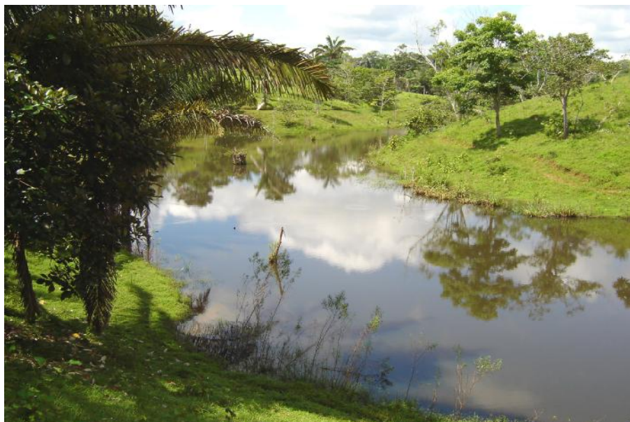
Fig. 2. Vista del reservorio, Jorge Berroa 2

La pesca es realizada en el reservorio por los dueños como recreación y deporte, estimándose unos por 5 pescadores eventuales, que utilizan como arte de pesca 1 anzuelo con caña de pescar, para una producción estimada de 25 kilos anuales. (Leonidas Padilla, 2004, comunicación personal)