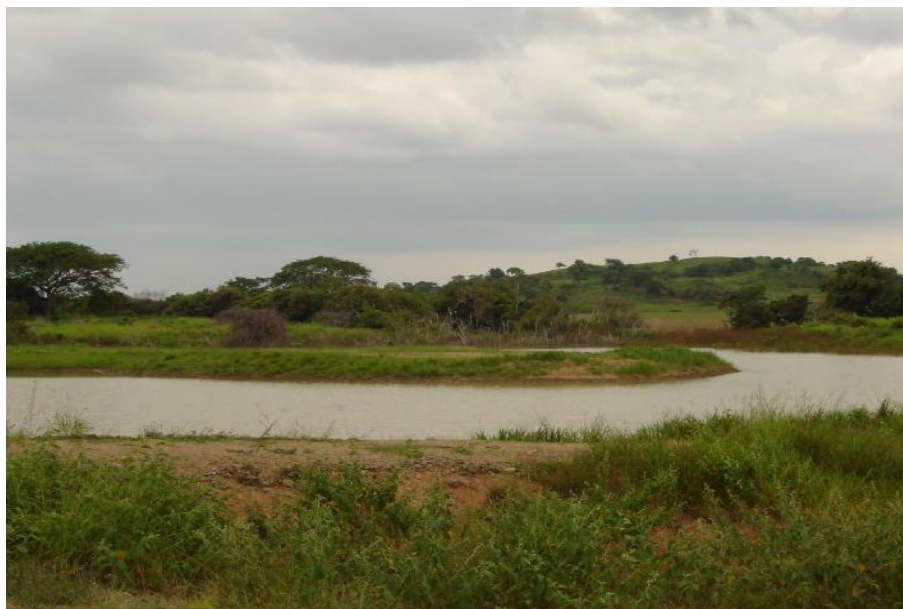
Fig. 2. Vista del reservorio, Juan Medrano 1

Debido a que es un cuerpo de agua privado, no hay actividad pesquera ni acuícola.