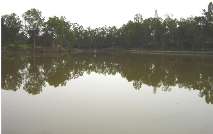
Fig. 2. Vista del reservorio Juan Medrano 2

No hay actividad pesquera ni existen proyectos de acuicultura en el reservorio o en su entorno.