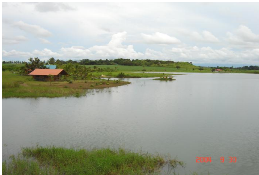
Fig. 2. Vista del reservorio, Justo Spiegel

El reservorio es de uso privado, utilizado para riego y recreación privada.