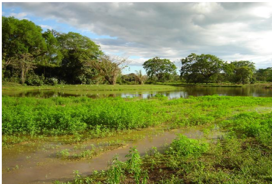
Fig. 2. Vista del reservorio La Isleta

No existe actividad pesquera en el reservorio ni proyectos de acuicultura en el cuerpo de agua o en su entorno.