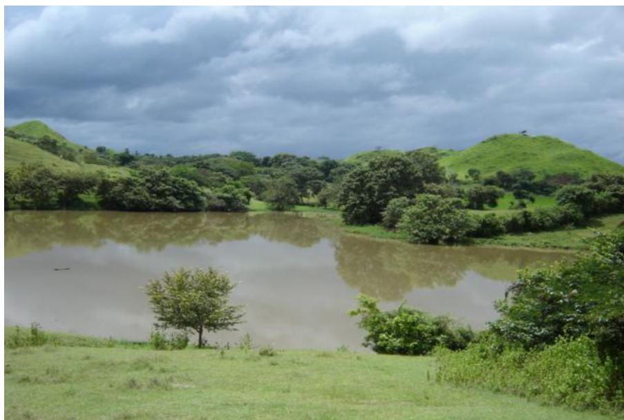
Fig. 2. Vista del reservorio, La Laja

Las características físico-químicas del agua presentan concentraciones en promedio de 5 mg/l para el oxígeno disuelto y temperatura de 27.5 °C. (PREPAC a, 2004) (Fig. 2)