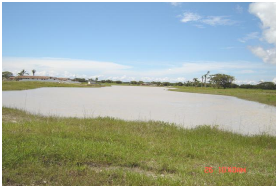
Fig. 2. Vista del reservorio, Lago 10 Buenaventura

Como reservorio privado no se realiza la pesca ni la acuicultura.