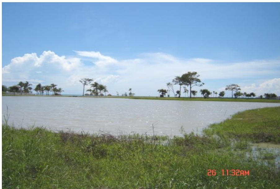
Fig. 2. Vista del reservorio, Lago 12 Buenaventura

Como reservorio privado no se realiza la pesca ni la acuicultura.