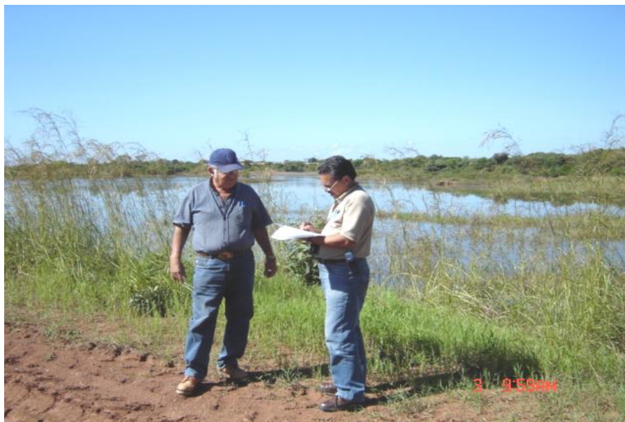
Fig. 2. Vista del reservorio, Lago2 Santa Rosa

La pesca en El Ingenio Santa Rosa, es realizada en el reservorio por 20 pescadores, de los cuales 10 utilizan como arte de pesca 10 anzuelos y líneas para una producción de 200 kilos y los otros 10 atarrayas para una producción de 300 kilos anuales. (Jaime Cisneros y Delmiro López, 2004, comunicación personal)