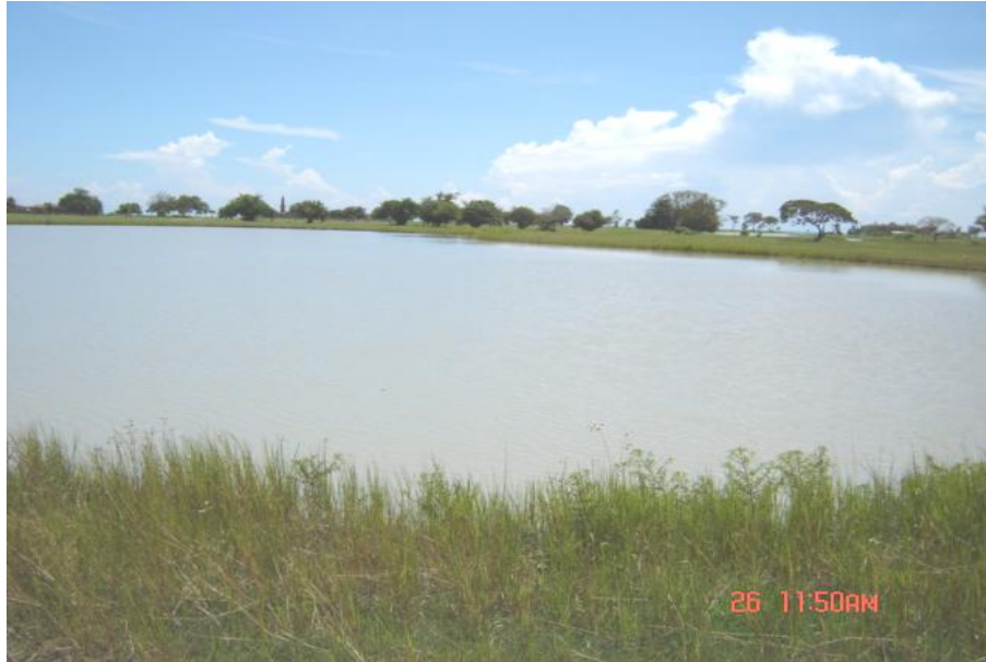
Fig. 2. Vista del reservorio, Lago 7 Buenaventura

Como reservorio privado no se realiza la pesca ni la acuicultura.