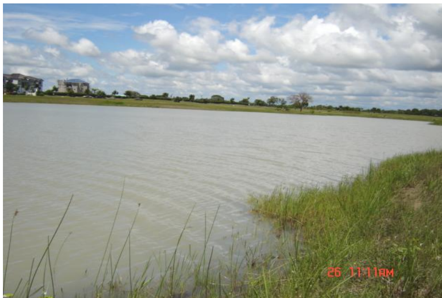
Fig. 2. Vista del reservorio, Lago 9 Buenaventura

Como reservorio privado no se realiza la pesca ni la acuicultura.