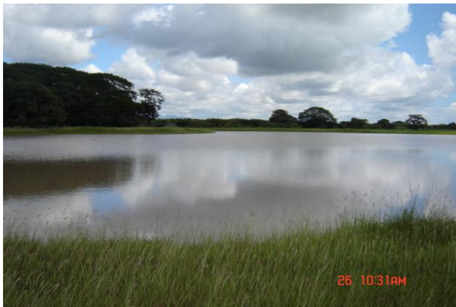
Fig. 2. Vista del reservorio, Lago A - Buenaventura

Como reservorio privado no se realiza la pesca ni la acuicultura.