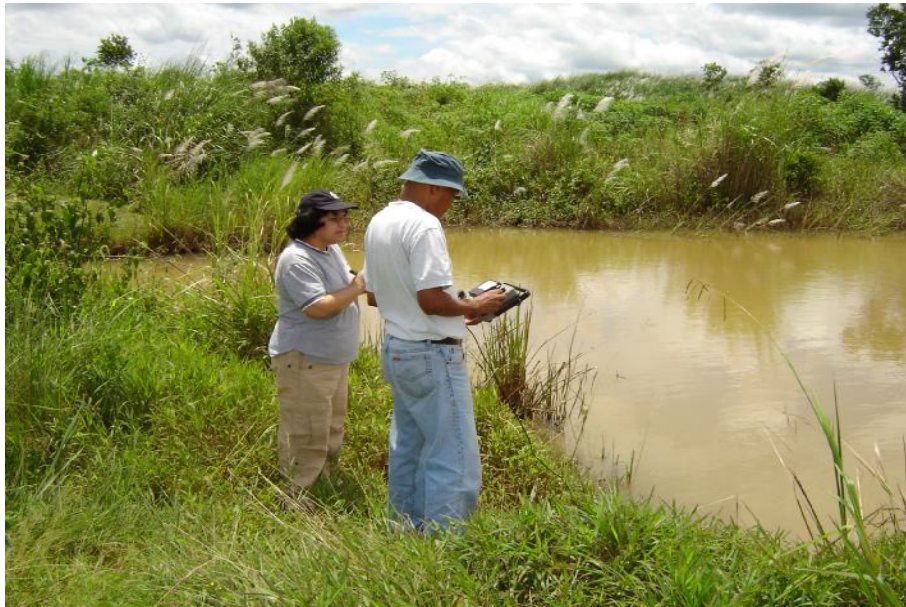
Fig. 3. Dificultad en la toma de parámetros físico-químicos, por el exceso de sedimentación.

En relación a contaminación y sedimentación se observa una coloración lechosa por vertidos de carbonato de calcio producto de la producción de cemento, lo que hizo difícil la toma de parámetros físico-químicos. (fig. 3).