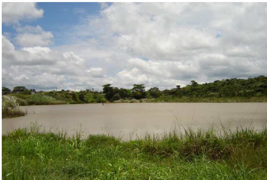
Fig. 2. Vista del reservorio, Lago Cemento Bayano

No hay actividad pesquera ni acuícola, toda vez que se considera por los moradores del área que las aguas están contaminadas por desechos de la planta de producción de cemento. (Pablo Castillo, 2004, comunicación personal)