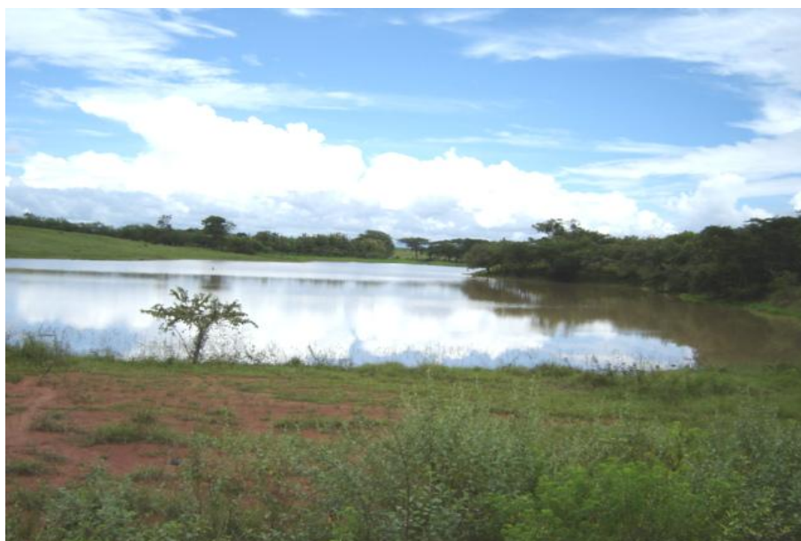
Fig. 2. Vista del reservorio, El Lago de Potuga,

Las características físico-químicas del agua presentan concentraciones en promedio de 5 mg/l para el oxígeno disuelto y temperatura de 30°C. (PREPAC a, 2004) (Fig. 2)