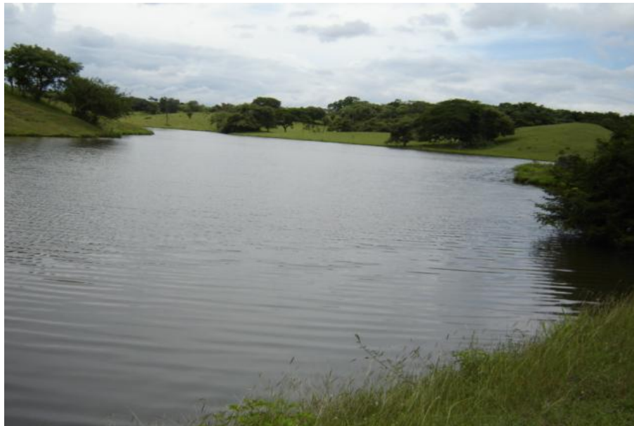
Fig. 2. Vista del reservorio, Las Guabas Arriba

Las características físico-químicas del agua presentan concentraciones en promedio de 7 mg/l para el oxígeno disuelto y temperatura de 30.5 °C. (PREPAC a, 2004) (Fig. 2)