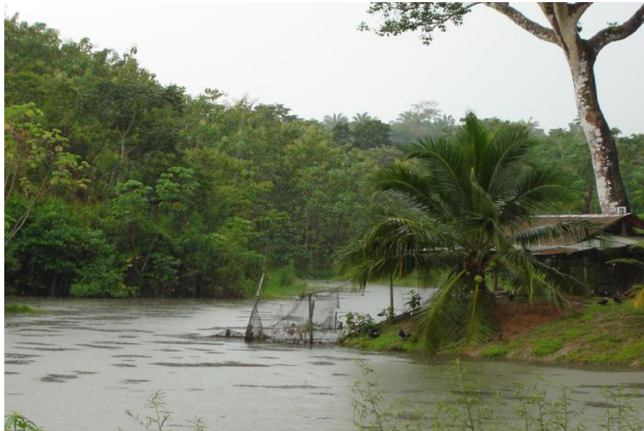
Fig. 3 Materia orgánica trasladada por el agua

No hay presencia de plantas acuáticas en el cuerpo de agua, no se tiene referencia de contaminación, pero por escorrentía se arrastra materia orgánica. (Fig. 3)