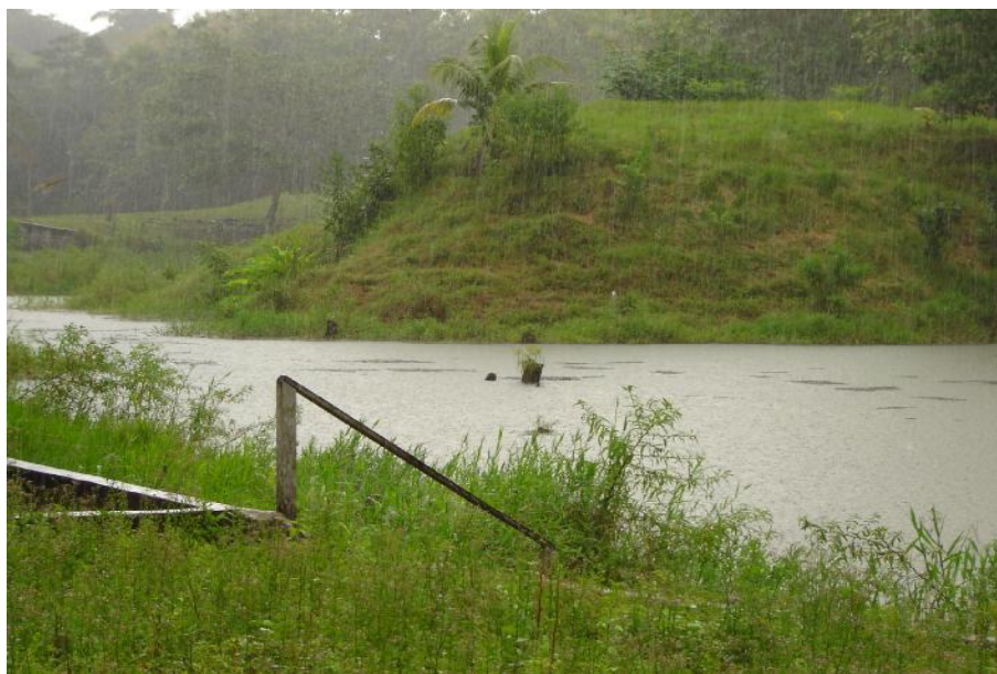
Fig. 2. Vista del reservorio, Las Irmas 1

No hay actividad pesquera ni acuícola, por lo cual tampoco infraestructuras para dichas actividades.