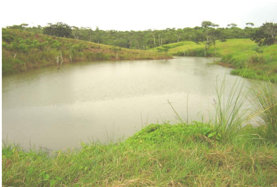
Fig. 2. Vista del reservorio, Las Irmas 2

No hay actividad pesquera ni acuícola, por lo cual tampoco infraestructuras para dichas actividades.