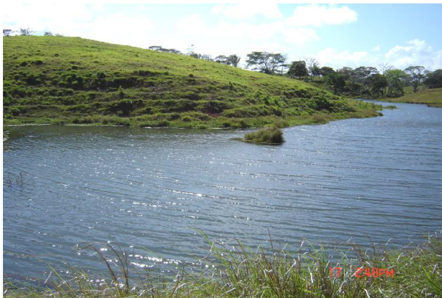
Fig. 2. Vista del reservorio, Las Irmas 3

No hay actividad pesquera ni acuícola, por lo cual tampoco infraestructuras para dichas actividades.