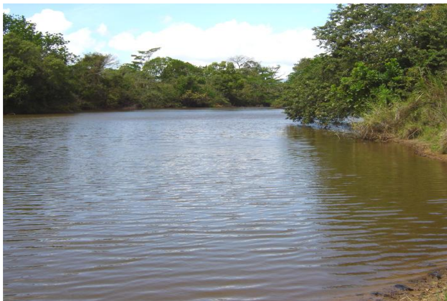
Fig. 2. Vista del reservorio Los Lagos 1

No se realiza pesca en este cuerpo de agua.