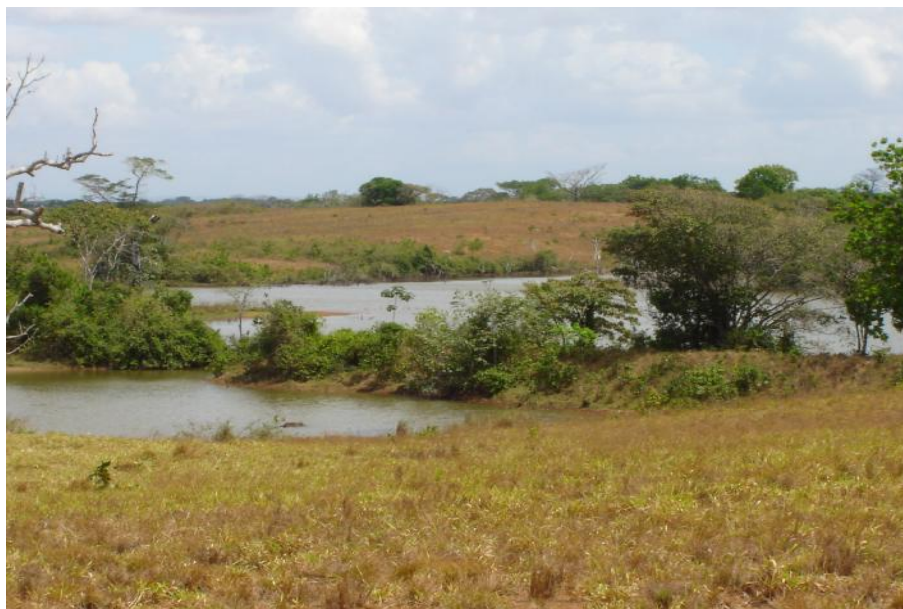
Fig. 2. Vista del reservorio Los Lagos 2

No se realiza pesca en este cuerpo de agua.